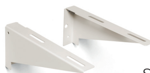
Staffe di fissaggio comprese